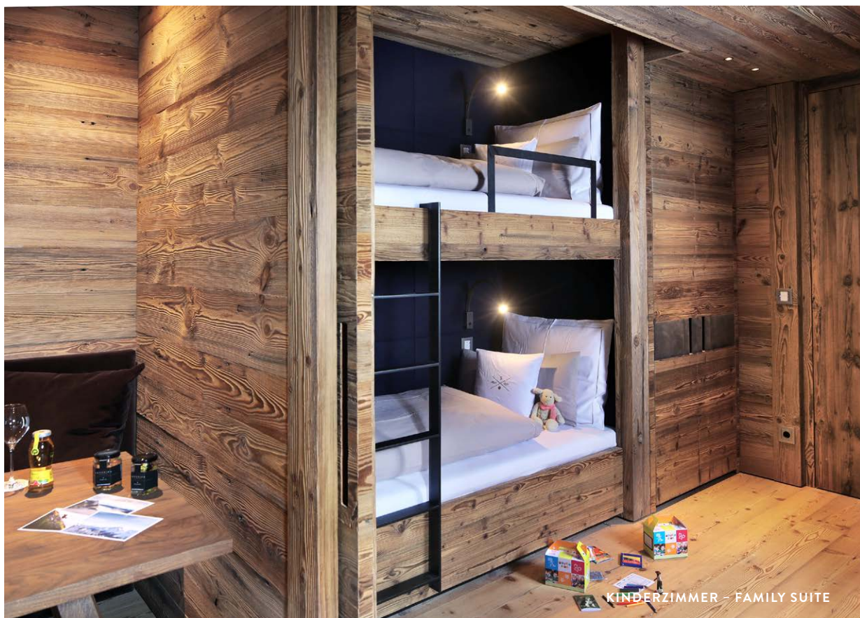
KINDERZIMMER - FAMILY SUITE