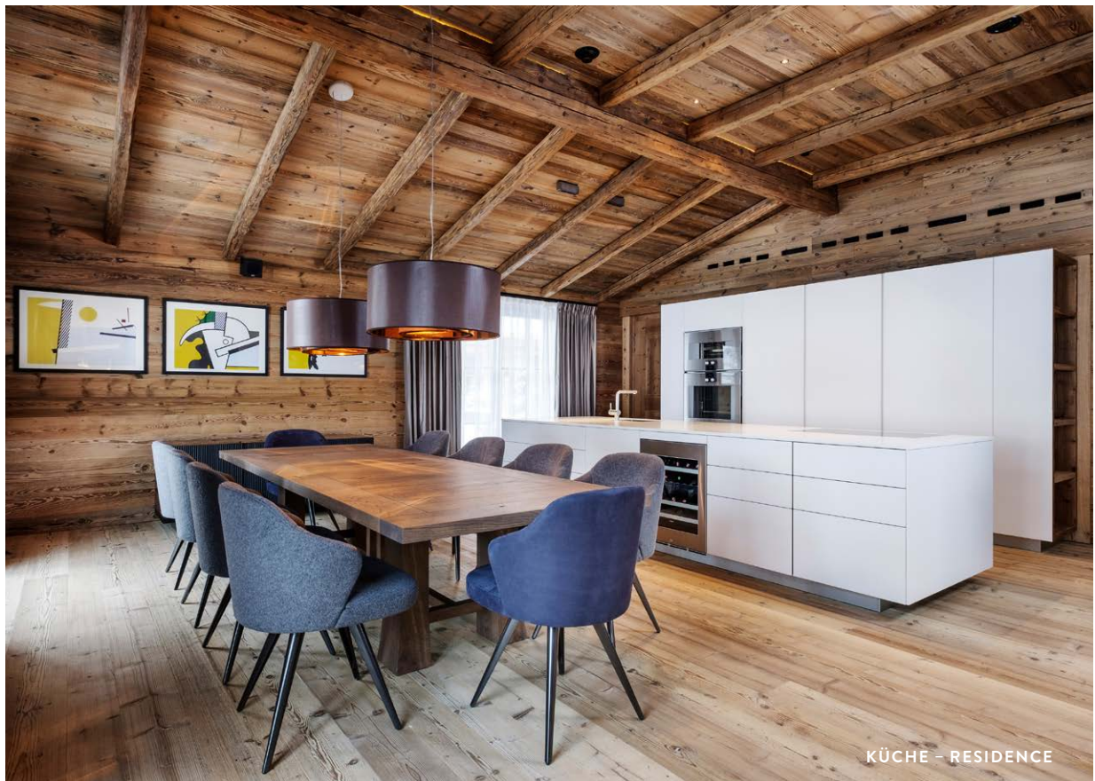
KÜCHE - RESIDENCE