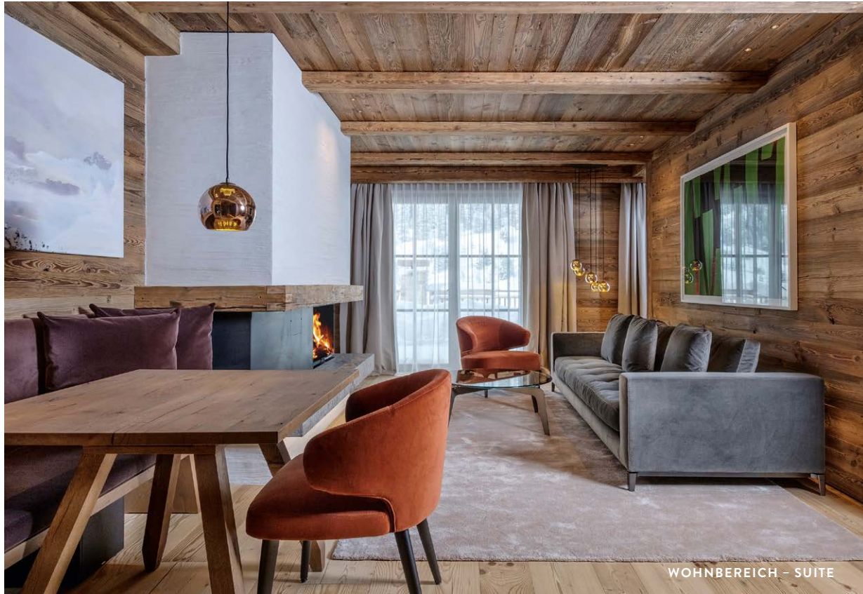
WOHNBEREICH - SUITE