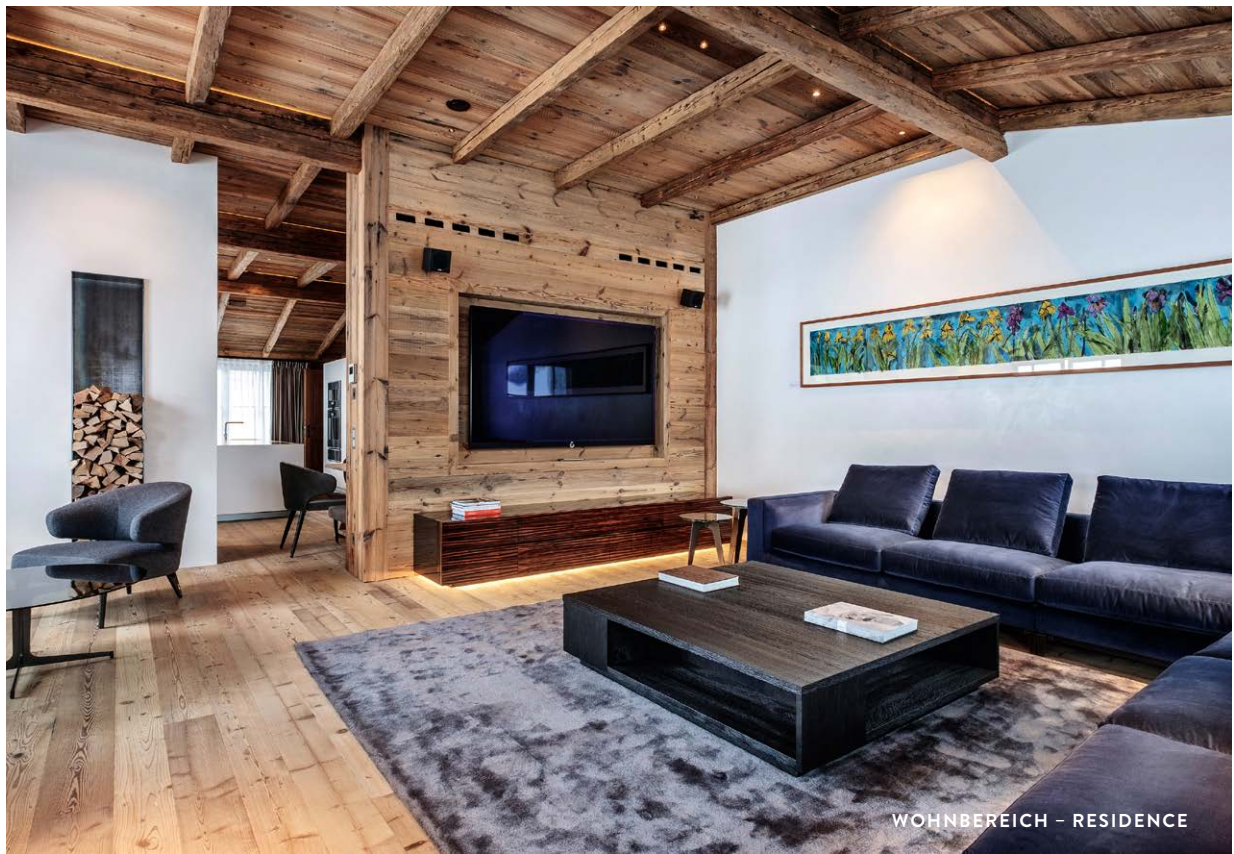
WOHNBEREICH - RESIDENCE